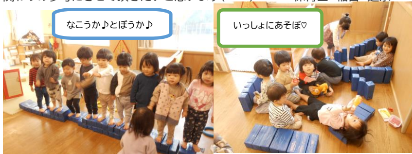
なこうか♪とぼうか♪