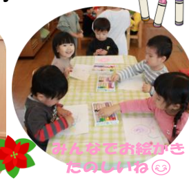
みんなでお絵かき たのしいね😊